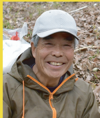
小砂環境芸術祭 実行委員会代表

最後に「KEAT小砂環境芸術祭2019」の開催にあたり、小砂地域の皆様やご協力とご支援を賜りました全ての関係機関並びに関係者の皆様方に、厚くお礼申し上げます。