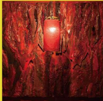
白田那智 インスタレーション