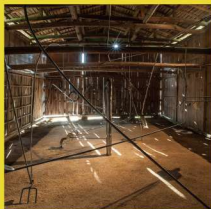
田原唯之 インスタレーション